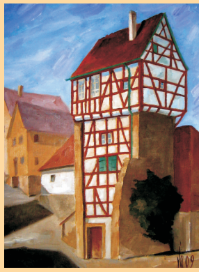
Schlosserturm Creglingen, Ölbild 2009 (40 x 30 cm)