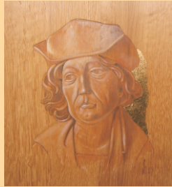
Tilman Riemenschneider, Tafel 2005 (35 x 32 cm)