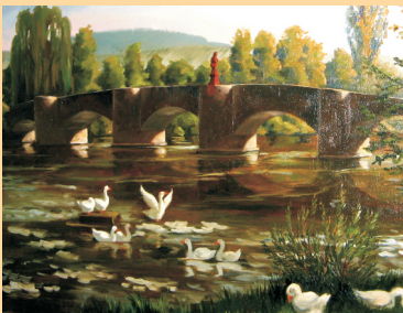
Tauberrettersheimer Brücke, Öl auf Leinwand (50 x 60 cm)