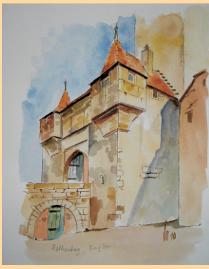
Burgtor Rothenburg odT., Aquarell 2010 (35 x 25 cm)