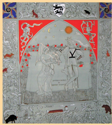
gotische Tafelmalerei, Tempera mit Tuschfeder (77 x 69 cm)