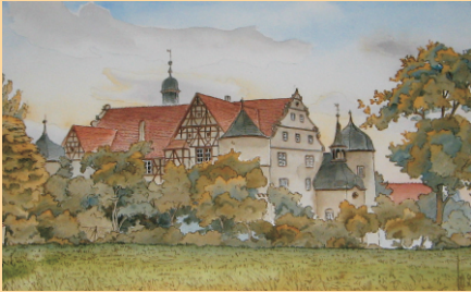
Schloss Waldmannshofen, Aquarell 1998 (44 x 60 cm)