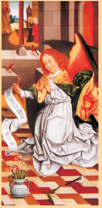
Herrgottskirche Creglingen, Ausschnitt Seitenaltar Holztafel 1990-1992