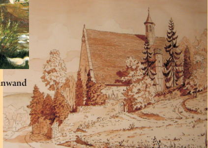
Herrgottskirche Creglingen, Lavierung 1995 (37 x 45 cm)