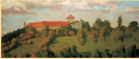
Burg Brauneck, Ölbild 1998 (22 x 44 cm)